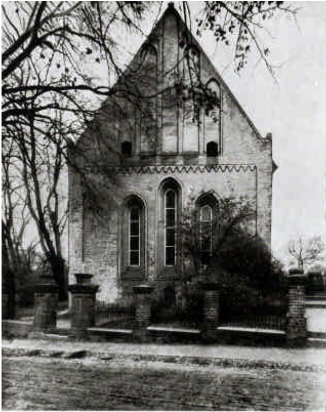
Kirche zu Stargard (Ostgiebel).

auch sind dort weitere Lisenen nicht vorhanden. Im Ostgiebeldreieck steigen in der Mitte fünf einfache schlichte Blendnischen mit stumpfen Spitzbogen, mit der Giebelschräge wachsend auf. Sie stehen auf einem drei Schichten hohen vertieften Band. Die beiden Seiten des Giebels lassen in den unteren Ecken unter Putz etwaige weitere Schmuckformen nicht erkennen.