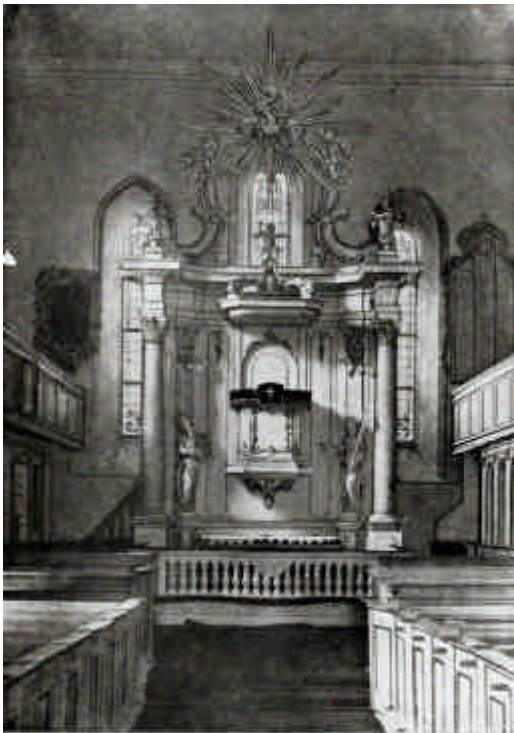
Kanzelaltar der Stadtkirche zu Stargard (1770).

Das Innere der Kirche ist nach Entfernung des Triumphbogens zwischen Chor und Schiff nach dem Brande einheitlich gestaltet. Unter der glatt geputzten Decke ringsum ein profiliertes Gesims.