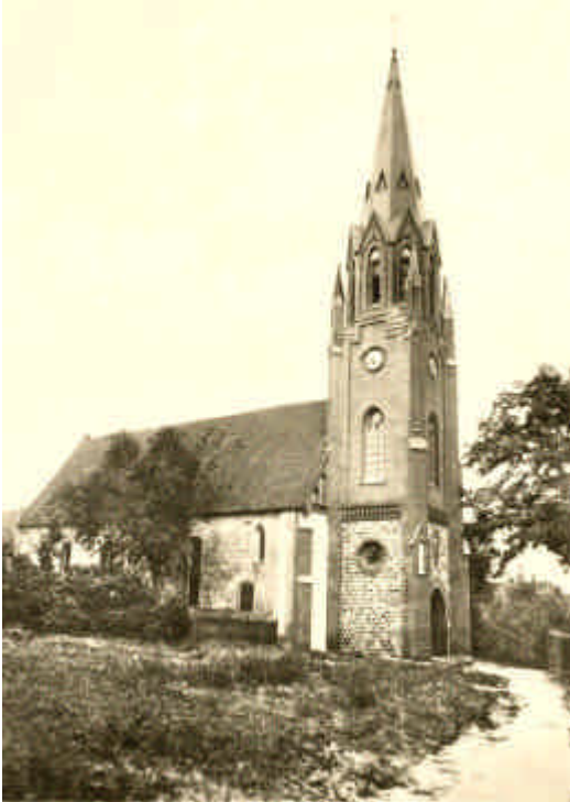
Ansicht der Nordseite ca. 1920

Die letzte große Baumaßnahme gab der Kirche im Jahre 1894 den jetzigen massiven Turm im neugotischen Stil. Die Basilika hat ein breiteres Westhaus gehabt, wie die große Spitzbogenöffnung der jetzigen Westwand und die Ansicht vor dem Bau des Turmes zeigen. Es ist bei dieser Gelegenheit abgebrochen.